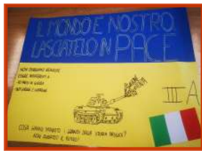
Classe III A