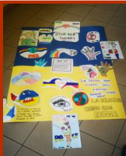
Cartellone per la pace

Giorno 2 Marzo è stato un giorno molto speciale per noi ragazzi della redazione del giornalino scolastico perché abbiamo incontrato il Sindaco del nostro paese, Giuseppe De Santis, il vicesindaco nonché Assessore alla pubblica