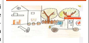
Disegno realizzato da Elisa Perfetti

tiere la cui missione è offrire assistenza medica dove c'è più bisogno, l'UNICEF che si occupa di assistenza umanitaria per i bambini e le loro madri in tutto il mondo. E' bello sapere che ci sono persone che decidano di propria volontà di dedicare anima e corpo ad una causa sociale spesso più grande di loro.