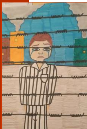
Disegno realizzato da Miriam Scarcelli classe III B