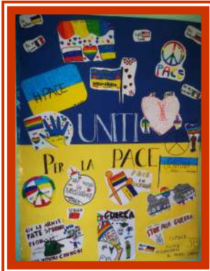
Disegno realizzato dalla classe III B scuola secondaria di 1° Grado

ro. Sono molte le persone che, come me, si sentono confuse e spaventate. In questo momento migliaia di persone stanno morendo per una guerra assurda e il mondo intero non riesce a fermare questo mostruoso conflitto con la diplomazia. Non c'è più. Ma forse, la verità è che tutto questo, non è mai finito! Ci dicono che