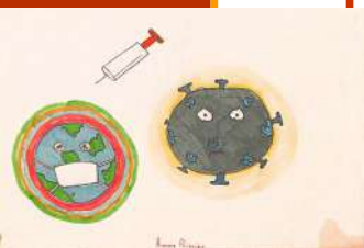
Aurora Principe classe I A

La creatività non è altro che un'intellig enza che si diverte".