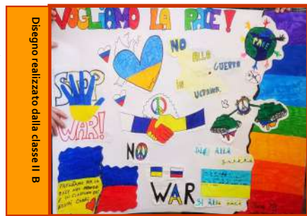
Disegno realizzato dalla classe II B