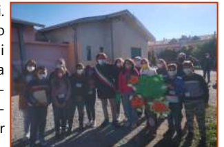
I ragazzi della redazione incontrano il Sindaco