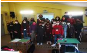
La redazione con il sindaco

periodo di pandemia. Abbiamo chiesto di inserire nel nostro territorio un parco giochi, piste ciclabili, ripristinare i campi da tennis e da calcio, aggiungere anche skatePark e infine luoghi di ritrovo per gli anziani. Il Sindaco, congratulandosi con noi studenti per l'interesse e la voglia di apprendere nuove cose, ha risposto alle sollecitazioni, annunciando, ad esempio, la volontà dell'Amministrazione di realizzare nuovi spazi dedicati alle attività giovanili, culturali e musicali, al Teatro Comunale e presentandoci i nuovi progetti per il nostro paese e per noi ragazzi. Durante l'incontro abbiamo affrontato diverse tematiche come la guerra in Ucraina e, a questo proposito, abbiamo