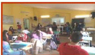
L'intervista al Sindaco

molto importanti e utili allo svago. Non sarebbe per niente male avere un parco con una pista ciclabile dove poter pedalare senza correre il rischio di essere investiti da una macchina o moto che sfrecciano ad alta velocità e uno SKATEPARK. Vorremmo che la nostra scuola fosse più attrezzata soprattutto per le attività sportive. In questo momento siamo anche privi della palestra comunale perché è usata come hub per le vaccinazioni. Si potrebbe migliorare il cortile esterno della scuola anche con un'area attrezzata. Ci sono delle belle querce e durante l'estate si potrebbe uscire e fare lezione all'aperto ma deve essere uno spazio più curato, attrezzato e non ci devono parcheggiare le auto perché c'è l'ombra. Vorremmo chiederle se fosse possibile mettere almeno una pensilina vicino alla nostra scuola secondaria di primo grado di Pianette perché durante l'inverno chi arriva con lo scuolabus è costretto a stare sotto la