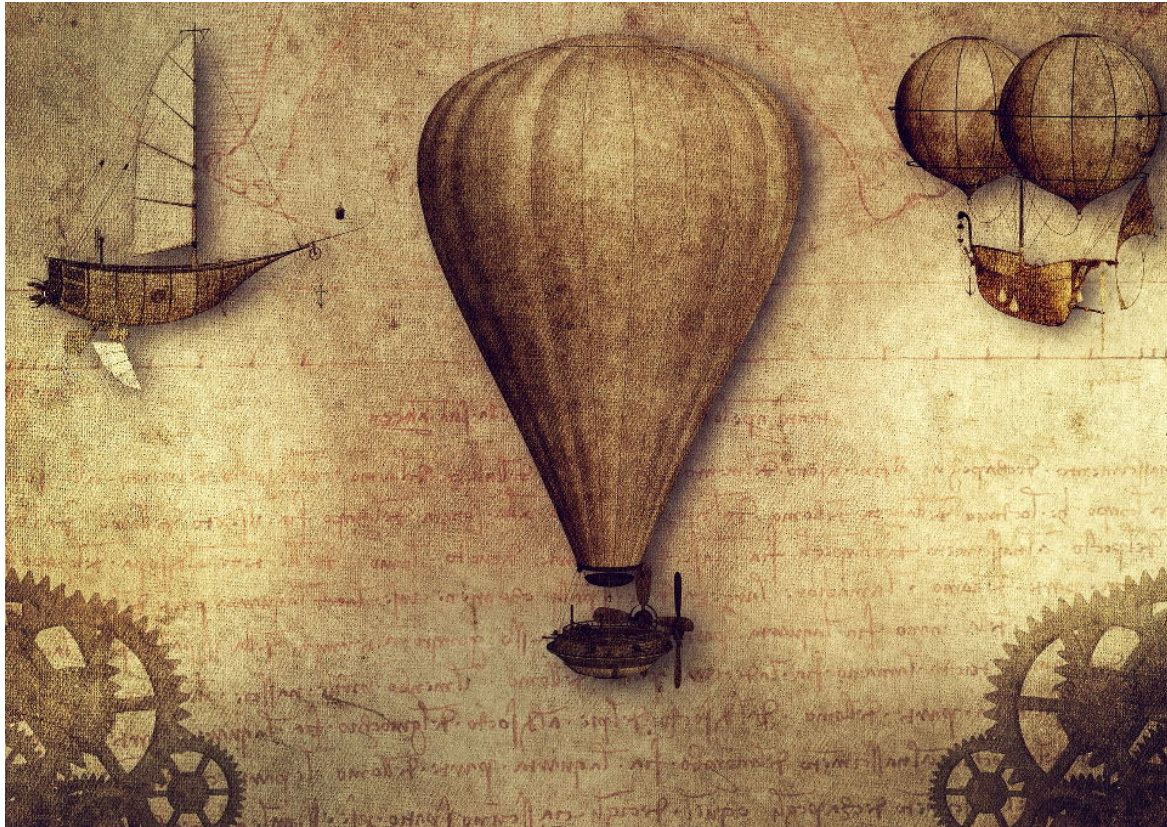
Leonardo da Vinci, Studio della mongolfiera.

Questa immagine rappresenta uno dei tantissimi disegni realizzati dal genio Leonardo da Vinci che raffigura lo studio di mongolfiere in varie tipologie e meccanismi di volo, di cui era molto appassionato.