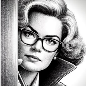
L'angolo della prof